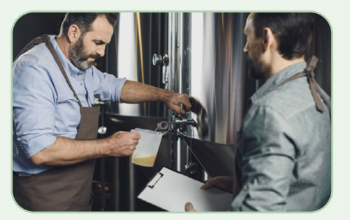
Brasserie et vinification