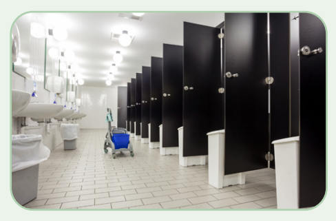
Hygiène de l'espace et contrôle des odeurs