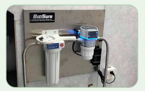
Maintenance préventive des canalisations d'eau