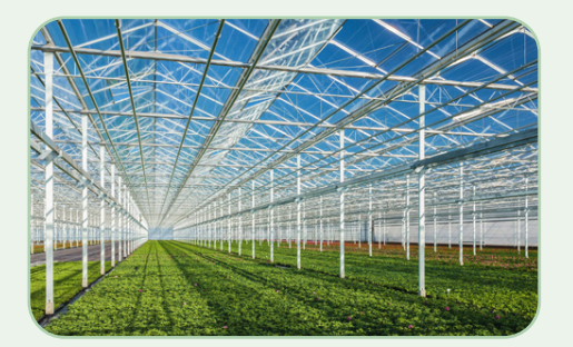
Agriculture et irrigation