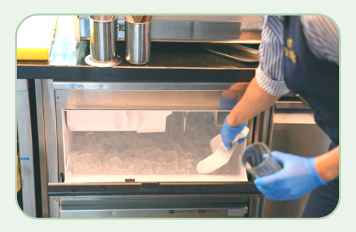
Glace et boissons